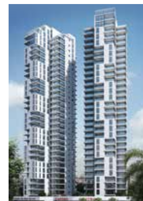
Concept בלפור בת ים