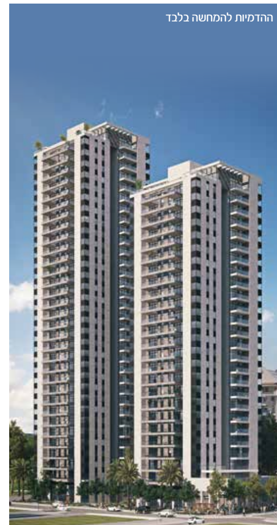
ההדמיות להמחשה בלבד