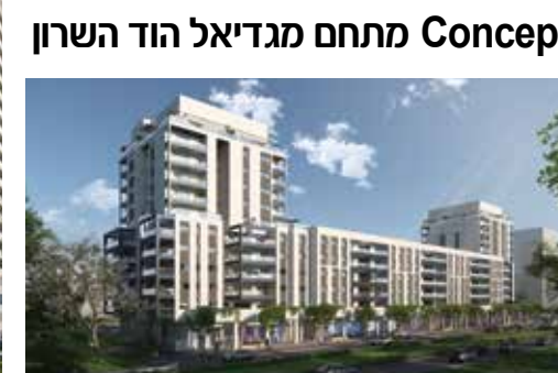
New Concept אור יהודה