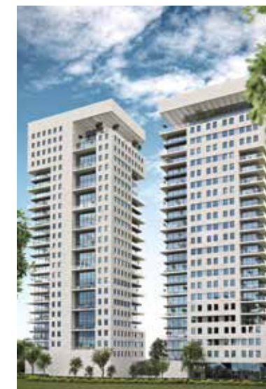
Concept מתחם מגדיאל הוד השרון יבנה