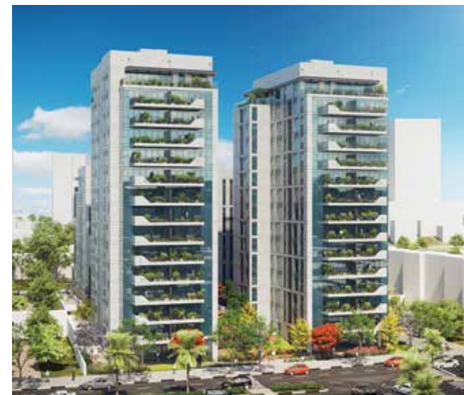
Concept דרך השלום ת"א