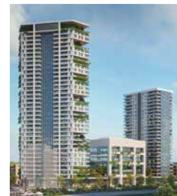
Concept כיכר המגנים בת ים