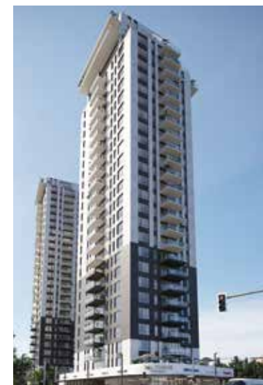
Concept החשמונאים בת ים