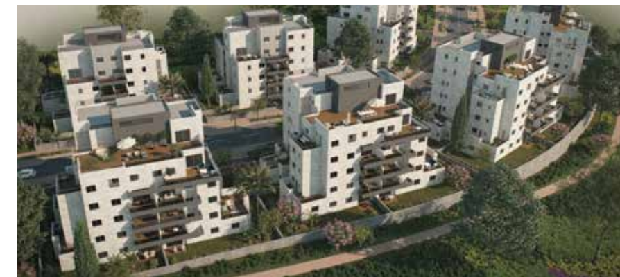
Concept כרמים מבשרת ציון